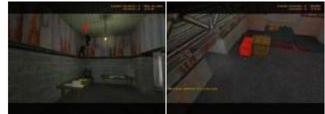
de_nuke에서 알려져 있는 버그플레이

버그플레이 확인 시 몰수 패 처리한다. 단, Flashbang Bug 발생시 해당 team에게 3라운드를 감점한다.