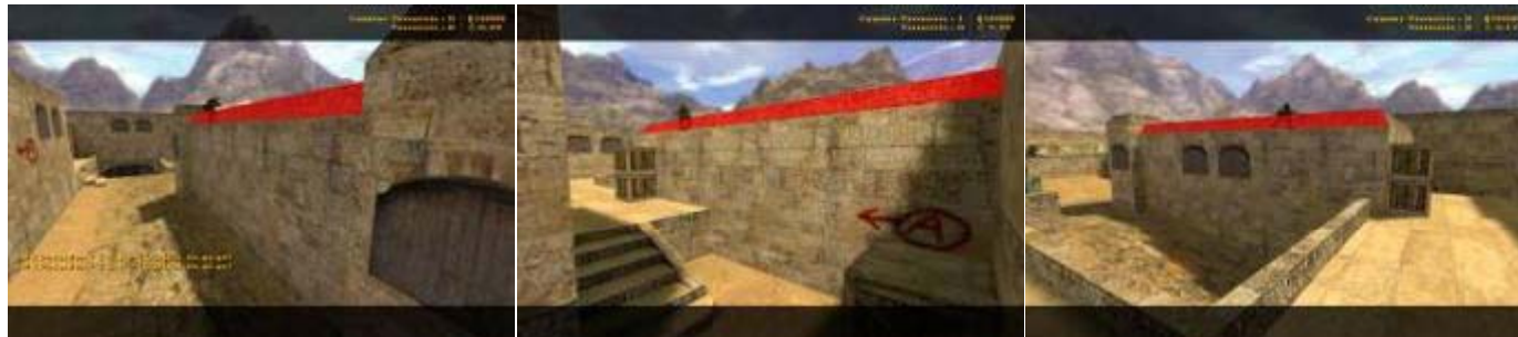
de_dust2 부스팅 금지지역